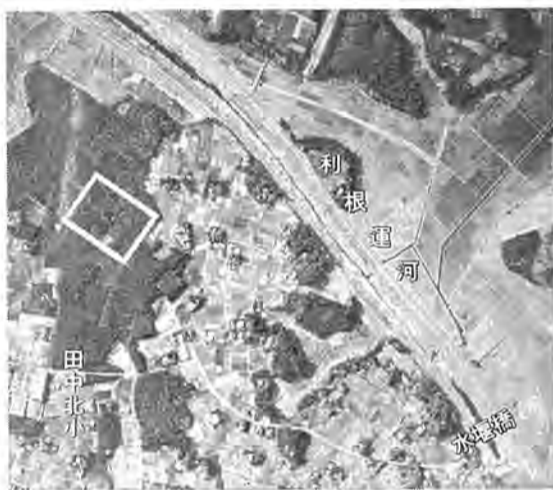
第二し尿処理場予定地(ワク内)

これは、総合運動場用地第三次分として八百九十四平方メートルの土地を、二千六百七十五平方メートルで取得するもので、これにより従来取得したものを合わせて、六万九千六百九十・五平方メートルになります。すでに二万四千立方メートルにおよぶ埋立工事が終了、この後、地盤整備を行ない、野球場、陸上競技場等各種運動施設の工事が進み、四十三年度中には大部分の完成が見込まれています。