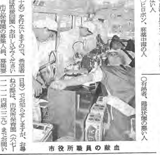
市役所職員の献血

旬間交通事故 12月16日~31日 市内 死者 1 40件 負傷 60 柏署 管内死者 2 81件 負傷 145 合図して 人と車のゆずり合い