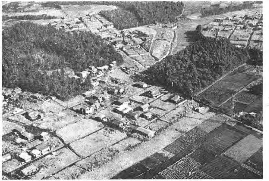
民間会社の手による住宅地開発も盛んに進められている。これは、小新山、新栄町など南部の新住宅地