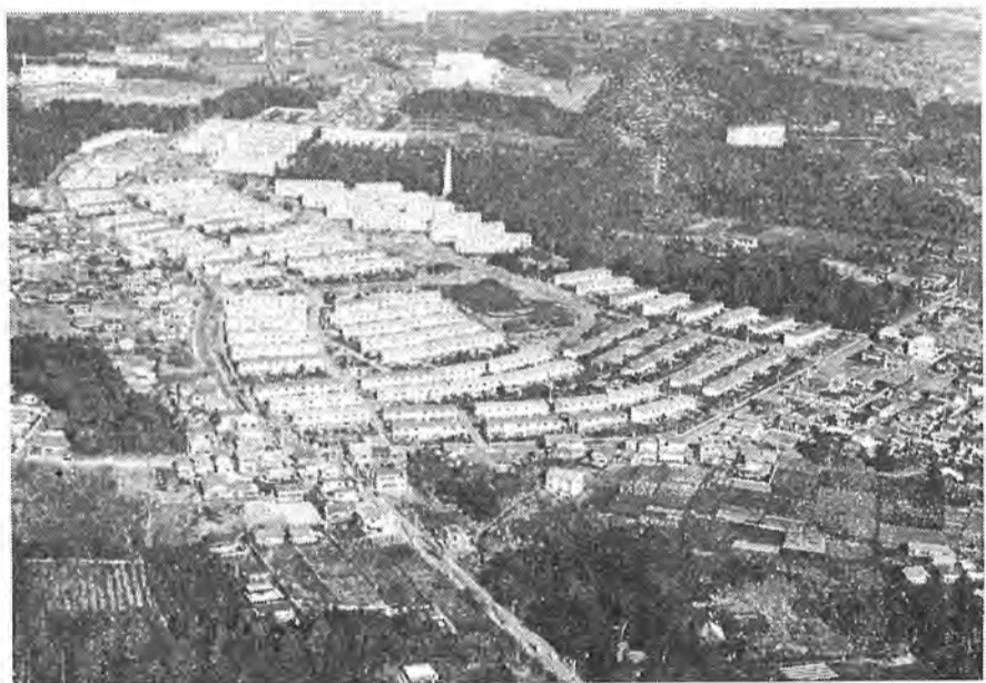
柏市が住宅都市として一躍脚光をあげる端緒となった光ヶ丘公園住宅