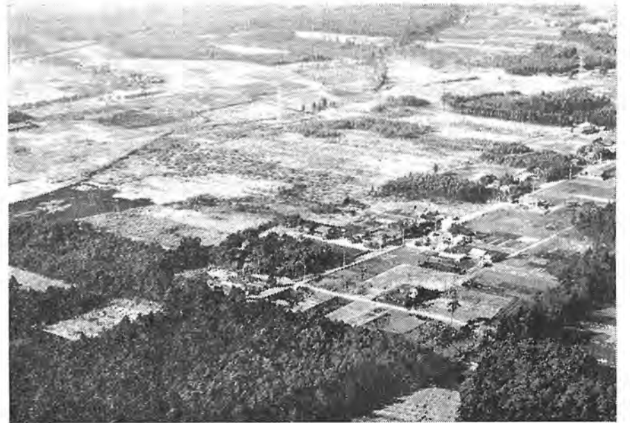
産業都市としての大きなステップとなる十余二工業団地予定地、現在では造成工事が進み、日々その姿を変えつつある