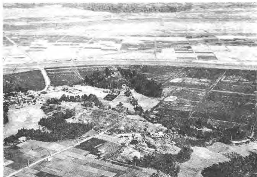
関東三弁天の一つとして著名な布施弁天 遠く利根川をへだてて、茨城県を望む。黒くみえる田は、農業構造改善の基盤整備が進められているところ