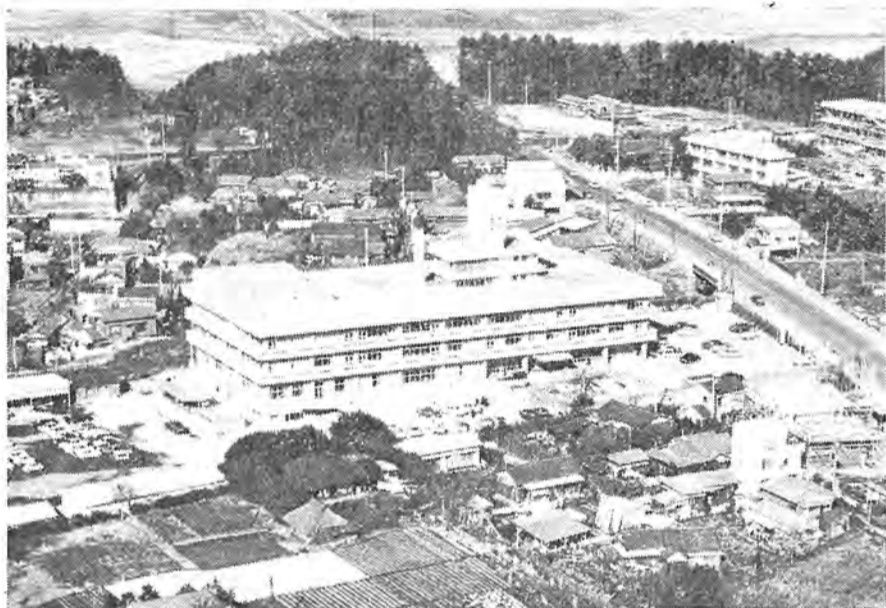
市のセンター柏市役所 16号国道と6号国道にはさまれ、白亜の直線が美しい