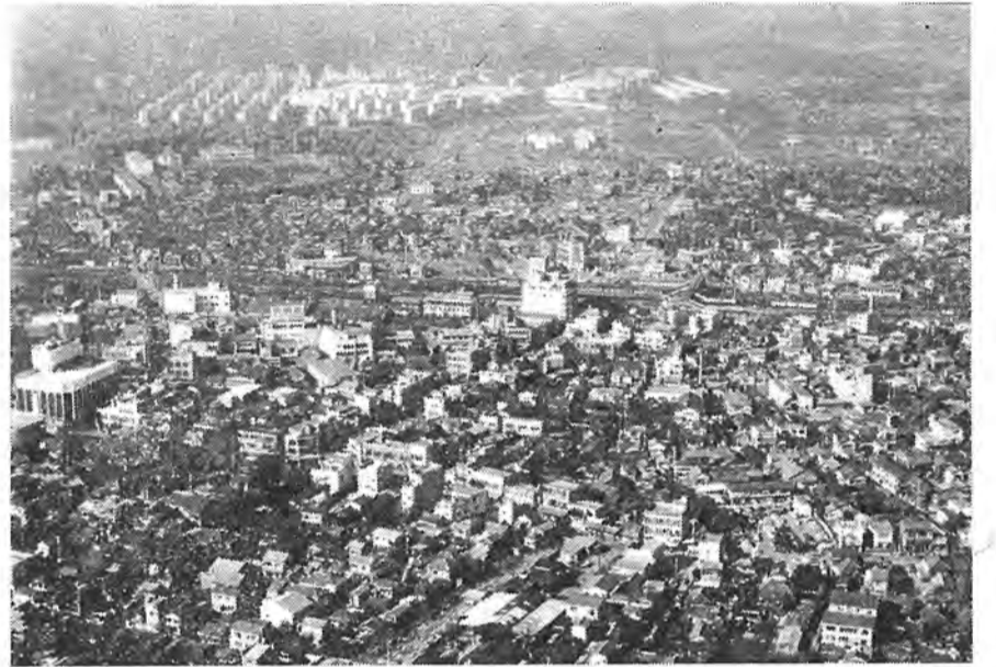
駅を中心とした市街地、豊四季団地が幾何学的線を書く