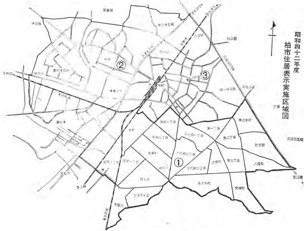
実施区域内町会名

これから実施を予定している関係地域のかたには、細かい点についてパンフレットや説明会でお分りいただくようにしますが、この事業を進めていくために必要な「世帯調査」や「家屋の出入口調査」を実施しますので、その節は、ご協力をお願いします。