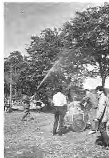
街路樹の消毒もいまがたけなわ (柏公園付近)

多量に発生した場合、薬剤を散布することになりますが、使用する薬剤は、粉剤でBHC三割、ディアテックス、乳剤ではディアテックス乳剤、DDVP乳剤などがあつて、このうちBHCは市販されていますが、ディアテックス乳剤は農協にあり、百CC入り百五十円位です。この薬剤を散布する場合は、他の植物や人畜に十分注意してください。市では、高性能の防除機械を導入、集団発生地を中心に防除につとめておりますが、市全域をくまなく防除しつゝことは難しいので、ご家庭や近所の街路樹などで見かけ次第防除につとめましょう。