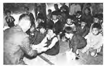
元気でねとお菓子をあげる

竣工式には、市長始め関係者多 数が集まり、お祝いのべました また県から県歌とバレーボールも 贈られ、青年の研修に使われます