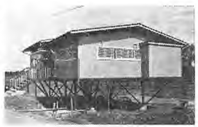
高床式の逆井青年館

このあと、参加者全員に、子ど も会の記念バッジが贈られ、楽し いひとときを過ごしました。