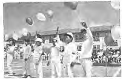
花の夕ネを飛ばそう