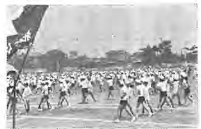
熱気あふれる会場

増尾の開園式には、松崎協議会 長や、福祉事務所長、地元の関係 者が集まり、おしいお菓子を賞 めて大喜びでした。お母さんたち も、おかげで農繁期も安心して働 けると喜ばれています。