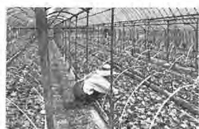
農業経営の近代化に農業委員の果す役割は大きい(共同育苗センターきゅうり苗)

この選挙に投票できる人は、次の三つの条件を備え、選挙人名簿に登録されている方となっております。 ○耕作面積が十アール以上の者、またはこれと同居している者 ○年間耕作日数が六十日以上の者 (昭和二十二年四月一日までに生まれた者)