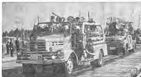
消防車の市内行進

新春恒例の出初式が、一月十四 日午前十時から柏中学校校庭で、 消防団員五百名が参加して行なわ れました。また、市消防署の誇る 新鋭ハシゴ車を始め、消防署、各 消防分団の消防車四十台あまりが ズラリと勢揃いし、市の消防力の 充実した姿を力強くみせてくれま した。 この日市長は、一日頃の訓練の 成果をもって市民の信頼に答えら れる消防団にとのべ、これに答 えるように折からの寒さにめげず 小隊教練やポンプ操法、分列行進