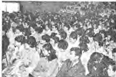
会場にあふれる参加者

キヤツプがあるだけなのに私達は彼等の人間性までも無視していいのでしょうか。 これらの問題は、彼等自身と彼等をとりまく両親や兄弟たちの問題としてのみ片付けておけばよい時ではなく、子ども達と一緒になつて私達みんなの問題として考えられたいとあけられていく社会こそ私達みんなの社会といえるのではないのでしょうか。 そういう社会をつくるということは、それは誰がつくつてくれるものでも、与えてくれるものでもありません。これからの私達が自分達の手をつくつていくものなのです。 私が常日頃考えていることは、地球上の何億という人間一人一人がみんな大きな鏡を持ち、毎日その鏡をみることできたらどんなにすばらしいことだろうということとです。そしてこの鏡は、単に自分の顔や姿だけうつせる鏡ではなく、世の中という大きな他人がどんな生活をし、どんな気持ちで生きているかをうつすことのできる鏡なのです。そんな鏡を一日も早く自分の手元において、私達はもう一度社会のすみからすみまでゆつくり考えながら、そしてみんなが話し合いながら鏡にうつし出してゆく必要があるのではないのでしょうか。 そういう鏡の中から、私は自分の納得のゆく生き方を求めていきたいのです。