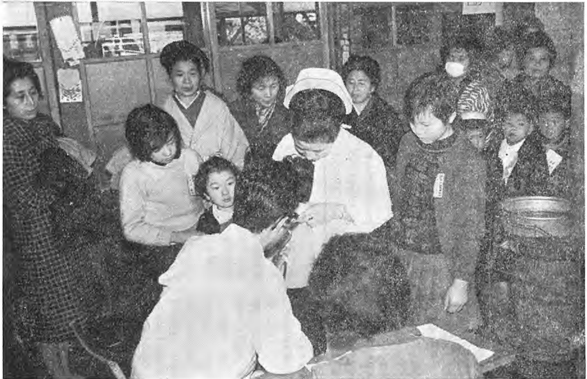
就学児童の身体検査