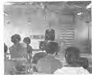
(マザースホーム開所式)