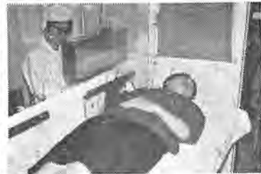
(昨年六月の献血風景)