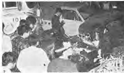
(国道六号線の事故現場)