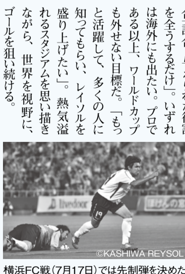
横浜FC戦(7月17日)では先制弾を決めた

※いずれも有資格者、若干名 勤務場所/市立柏病院 賃金/市立柏病院給与規定による ※経験者優遇 ④電話連絡の上、写真をはった履歴書と資格免許証の写しを、〒277-0825布施1-3 柏市立柏病院へ、8月10日(火)までに郵送で(必着) ⑤選考方法/書類と面接 ⑥市立柏病院 ☎7134-2000(月~金曜日 午前8時30分~午後5時)