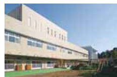
こども発達センター