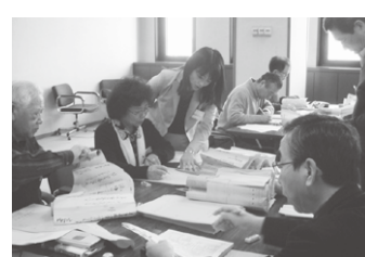
昨年行われた整理作業

①古文書=6月1日(火)～4日(金)、7月5日(月)～8日(木)(計8回) ②写真=6月21日(月)・22日(火)、7月12日(月)～14日(水)(計5回) ※いずれも午前9時30分～午後4時 沼南庁舎 ①=先着70人程度 ②=先着50人程度 ※市内在住・在勤・在学のかたを優先 市で所蔵する写真・古文書史料の年代や内容を調べ、封筒に封入し整理します 5月17日(月)午前9時から、文化課へ電話で 文化課 ☎7191-7414