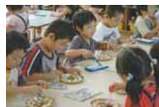
児童センターの催し