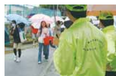
子どもの見守り活動