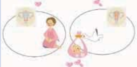
子宮がんの予防ポイントは 早期発見・早期治療

子宮頸(けい)がんは近年20~30歳代のかたの発症が増加しています。また、乳がんは30~50歳代の働き盛りの女性での死亡率が第一位です。これらの女性