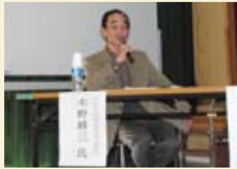
地域の講座で地元の奥深さを語る

「なぜなぜ坊や」だった少年時代。「寝る前に算数の問題を解くとすっきり眠れるというほど勉強好きだった兄たちと比べて、自分は何も知らない。「なぜ食事をするのか」「なぜトイレに行くのか」、いろいろなこと疑問を持ちながら育った」。調べることは面白い、柏の奥深さを埋没させておくのは本当にもったいない、と今も目を輝かせる。