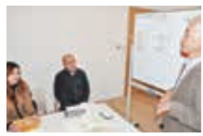
▲熱心に日本語を勉強中

日本語ができないと柏で生きていけない。東京では、不便を感じなかったんですけど…。自分が英語を教えている場所で、日本語を習っています(笑)。