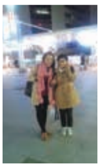
▲柏駅東口のイルミネーション前で