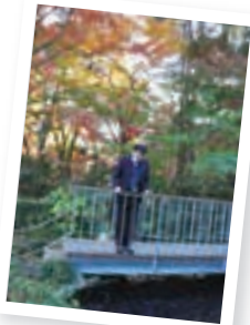
▲学生時代によく散歩していた構内の橋の上で

周りに干渉しない人が増えていると感じます。学生たちが社会人になる前に、地域のひととの関わり方を教えられる最後の場所が大学だと思います。自分が日本でやってこられたのも、優しく温かい周りの皆さんのおかげです。だから今は、自分が誰かにやってあげる番。学生たちにも周りの人から受けた恩をいつか誰かに返すことが大切だと伝えています。