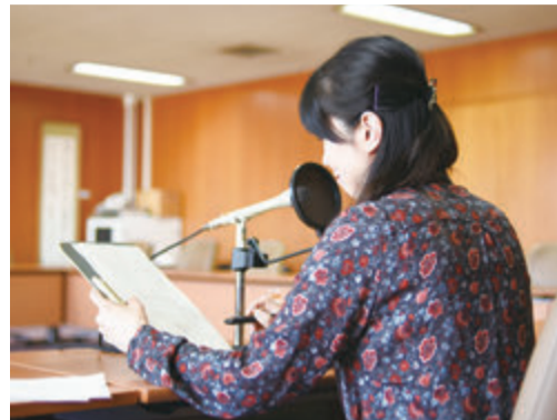
▲市役所で声を吹き込む三石さん

市内を巡回し、犯罪の発生予防等を呼び掛けるサポカーに新たな声がかかります。県立柏南高等学校出身で誰もが一度は聞き覚えのある声の持ち主の三石琴乃さんが、ゆかりある柏のために協力していただきました。美少女戦士セーラームーンの月野うさぎ役や、新世紀エヴァンゲリオン of 葛城ミサト役など多くのヒットアニメで活躍されている三石さんの声は、5月中旬から市内を駆け巡ります。