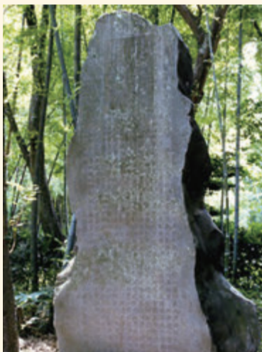
▲地名の由来を刻む開墾碑(十余二皇大神社)

1869(明治2)年、岩倉具視に見出された市岡は、小金牧開墾を請け負った三井組の現場責任者として小金牧開墾を指揮し、養蚕・製茶など殖産事業を積極的に進めたり、三井学校や皇大神社(こうたいじんじゃ)を建設したりするなど、十余二村の基盤を整備していきました。