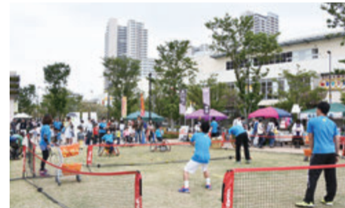
▲車いすテニスは想像以上に腕力が必要です