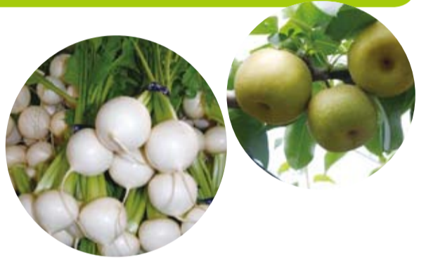
柏市の主な農産物(平成17年度)

● 農産物の生産 台地では約八百ヘクタールの畑地で、約千九百戸の農家のかたがたが、野菜やナシを中心とする果樹を生産しています。農産物産出額は、平成18年度で九十五億八千万円、全国では千八百二十市町村中二百五十四位、県内では十三位となっています。品目別では全国的に「豊四季小かぶ」として産地化されているかぶや、ハウレンソウ、ネギ、枝豆など「葉もの野菜」が中心に生産されていて、県内順位では十五品目が十位以内の生産となっています。