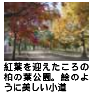
紅葉を迎えたころの柏の葉公園。絵のように美しい小道

柏の葉地区を周回する一般道のコースです。大型のショッピング施設や建設中のビル群、大堀川の水源のこんぶくろ池、紅葉シーズンには特に印象深い県立柏の葉公園や千葉大学のキャンパスなどさまざまな趣が味わえます。詳しい地図は柏の葉アーバンデザインセンター(UDCK)で入手できます。また、駅前でレンタサイクルの利用もできます(別掲「レンタサイクル情報」参照)。千葉大学キャンパス内は土・日曜日、祝日など大学が休みの日は通行できません。