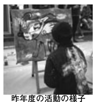
昨年度の活動の様子