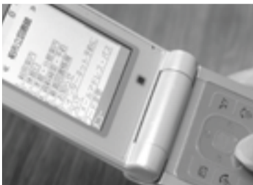
図書館ホームページの内容の一部が携帯電話で利用可能に

5月20日(火)から市立図書館のホームページに、いつでも気軽に利用できる携帯電話用のサイトを開設します。資料の検索のほか、パスワード登録が済んでいる場合は検索した資料の予約ができます。また、予約した資料が届いた時にはメールで連絡します。