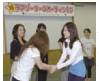
4月に行われたオーディションの会場で合格者と

船橋市在住。チームの出演依頼については、柏商工会議所青年部事務局（☎7162-3305）まで