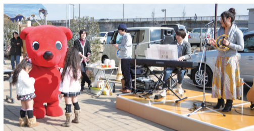
▲チーバくんも一緒にミニライブを楽しみました