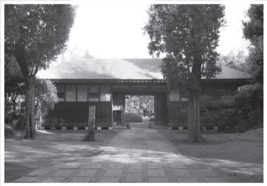
▲弘化4(1847)年に建築された長屋門

北部地域に多く、北を向き地域の境に立ち、疫病を防ぎ福を招く神としてまつられています。