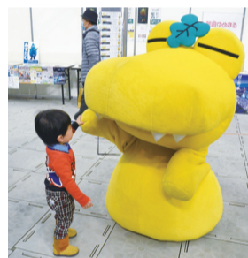
▲子どもと親睦も深めました