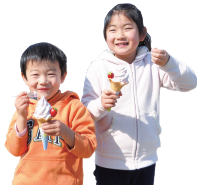
▲おいしい〜!一口食べてこの笑顔

寒さも緩み春のような陽気となった2月11日、道の駅しょうなんでイチゴフェアが開催されました。柏の新鮮なイチゴや洋菓子などの加工品が販売され、摘みたてのイチゴは開店後わずか1時間半で完売。再販売を待つ人で行列ができるほどの大盛況でした。また、イチゴのソフトクリームも行列が途絶ず大人気ぶり!他にも、賞品を獲得できる「イチゴクイズ」や市内でも活動するミュージシャンのミニライブで盛り上がりました。