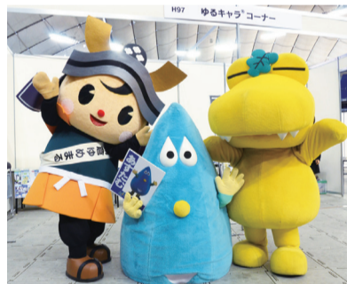
▲他のゆるキャラとわが街をPRしました

世界各地のさまざまな蘭が展示され、毎年10万人以上の来場者でにぎわう「世界らん展」。今年も2月14日から9日間にわたり東京ドームで開催されました。2月19日には、来場者に柏市をPRするため、会場内のゆるキャラコーナーにカシワニも参加!柏市を紹介する観光マップやイベントチラシなどを配布したり、ステージで街の魅力を伝えたりしました。これから桜やチューリップで華やぐ柏の街に好印象を持ってもらうことができ、カシワニのPR活動は大成功となりました。