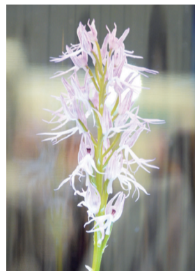
▲「ランの妖精」オルキスが国内初公開されました