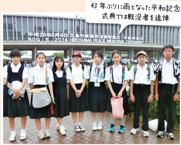
43年ぶりに雨となった平和記念式典で戦没者を追悼