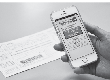
▲簡単な操作で支払いできます

対象となる市税 ／市・県民税(普通徴収)、固定資産税・都市計画税、軽自動車税、国民健康保険税(国民健康保険料は対象外)