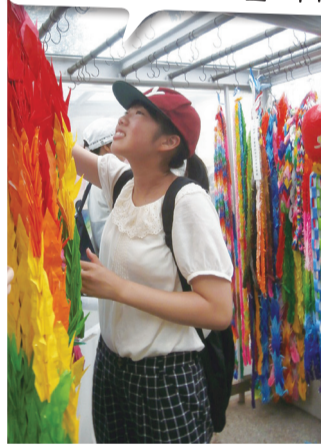
市内15の小・中学生が作った千羽鶴を平和記念公園に奉納