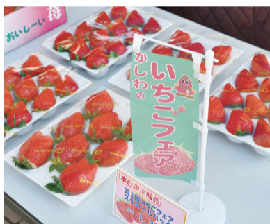
▲甘酸っぱい香りが広がりました