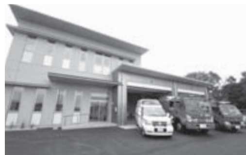
▲太陽光発電の設置、使用水の再利用など環境に配慮