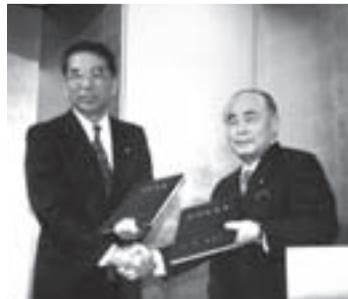
◀柏市・沼南町合併協定の調印式(平成16年)

約1年9カ月間の協議を重ね、平成17年3月28日に人口約5万人の沼南町と合併が実現、新生「柏市」が誕生しました。また、平成20年4月には中核市へ移行。より多くの市民サービスを市の責任のもとに行えるようになり、自立した都市を目指すべく、新たなステージを歩み始めました。