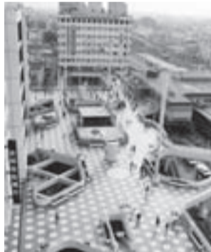
▲「ダブルデッキ」の名で親しまれる広場が完成(昭和48年)

街の玄関口である柏駅は、約120年前の明治29年に開設(本紙8面「かしわの記憶」で紹介)。時と共に駅前の整備は進み、昭和48年の東口再開発事業では「ダブルデッキ」や、駅前東西の顔「柏そごう」「柏高島屋」が建設され、商業都市として著しい成長を遂げていきます。