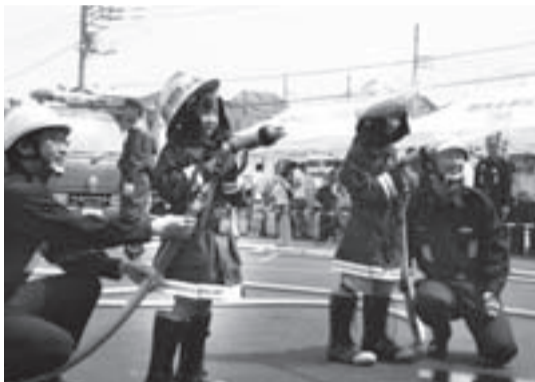
▲ポンプ車放水体験