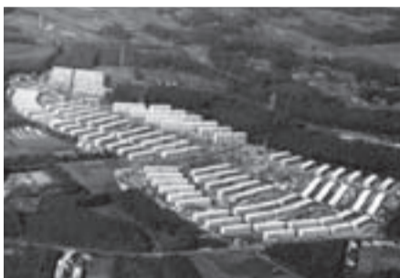
▲全国初の大型団地の光ヶ丘団地(昭和32年)

光ヶ丘団地内にはスーパーや病院など生活施設も作られ、ニュータウンの先駆けに。世の注目を集め、競争率はなんと14倍！数年後には豊四季台団地も建設され、まさにベッドタウン柏の幕開けを告げるものでした。