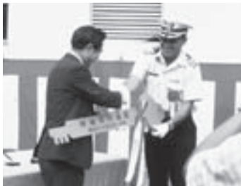
▲米軍柏通信所返還式(昭和54年)

終戦後、柏北西部の十余二帯は米軍に接収され通信所に。昭和54年に日本へ全面返還され、東京ドーム40個分の広大な跡地には、県立柏の葉公園や最先端の研究教育施設が次々と建設されました。また、つくばエクスプレス開通を契機とした区画整理により、柏の葉地域は大きく変貌を遂げていきます。