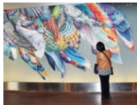
▲無数の羽根の色鮮やかな配色が印象的だった「光壁」