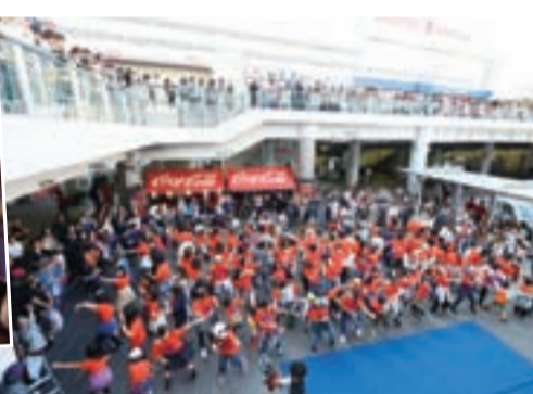
▲135人のダンサーが今のはやりのフラッシュモブを披露