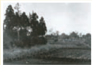
▲大正10年頃の柏駅前の風景(中央奥の煙が蒸気機関車)