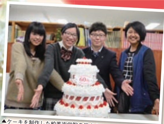
▲ケーキを制作した柏美術学院の皆さん

記念すべき日をみんなで祝いするとともに、繁栄の礎を築いてこられた先人のかたがたへ感謝を込めて、柏美術学院の皆さんにご協力いただき、ペーパークラフトで特製ケーキを制作しました！