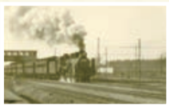
▲煙をき柏駅を出発する蒸気機関車