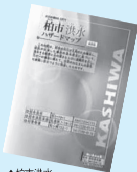
▲柏市洪水ハザードマップ

配布場所／防災安全課(市役所本庁舎2階)、下水道整備課(市役所分庁舎1の1階)、各近隣センター※市のホームページからダウンロード可