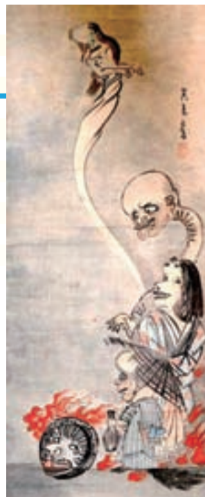
妖怪たち(法林寺蔵)