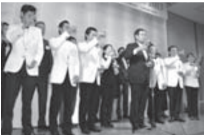
▲昨年のかしわウイスキーフォーラム