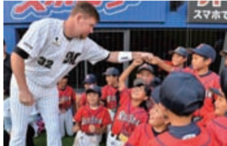
▲ロッテの4番打者ブラゼル選手と交流する子どもたち