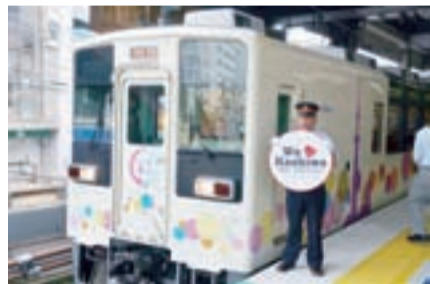
▲団体専用で眺めの良い「スカイツリートレイン」