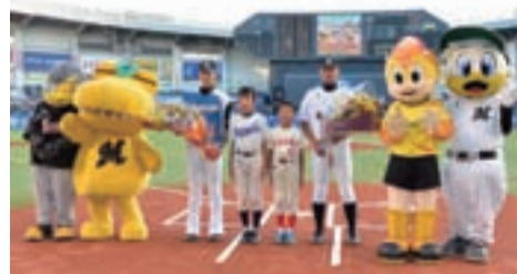
▲選手に花束を贈呈した市内の野球少年たち

柏市内の小・中学生約1,000人が、7月5日に千葉ロッテマリーンズ本拠地のQVCマリンフィールド(千葉市)で開催された北海道日本ハムファイターズ戦に招待されました。これは、未来を夢見る子どもたちにプロ野球を通じて夢と感動を与えることを理念とする千葉ロッテマリーンズ柏後援会の活動の一環で行われたものです。参加した小・中学生は選手と交流を深めたり、試合の始球式を務めたりしました。