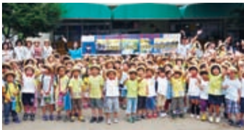
▲柏駅近くで電車を見送る園児たち

柏市は1954年11月15日に誕生し、市制施行60周年を迎えています。これを記念して、市では貸し切り列車「柏市民号」を企画。この第1弾「会津只見の旅」が、7月16日・17日に行われました。参加者の皆さんは、東武柏駅から乗り換えなしで行ける観光列車「スカイツリートレイン」に乗り込み、福島県只見町を訪問。現地ではそば打ちや記念植樹を体験したり、町内の観光名所を巡ったりしました。参加されたかたは、「初めて只見町を訪れてみましたが、とてもいいところでした」と感想を述べてくれました。