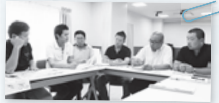
▲今号を担当した柏市老人福祉施設連絡協議会南部地区広報委員のメンバー