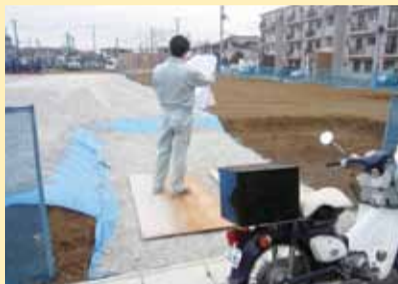
▲市内を巡回し土地を確認

土地は利用の仕方によって税額が変わります。そのため、職員が市内全域を巡回して新たに売買があった土地の利用状況や、利用状況が変わった土地はないかなどを調査しています。