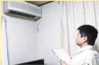
▲各家庭へも調査に伺います

一方、家屋については壁や床、間取りの様子などを確認するために家屋調査をしています。皆さんが新しく家屋を建てた時には職員が伺いますので、ご協力をお願いします。