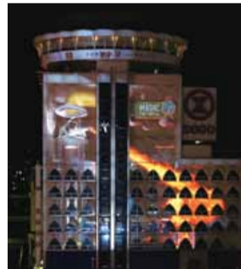
▲舞台となった壁面の高さは国内最大級