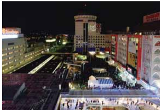
▲イベントで一層にぎわった柏駅前周辺

国内最大級の規模と豪華クリエイター陣の競演で行われたプロジェクションマッピングイベント「ヒカリデッキかしわ2013」が、12月20日から3日間にわたり柏駅東口ダブルデッキで行われました。悪天候のため残念ながら中止となった2回を除く、計7回で延べ10,827人が音と光の感動に包まれました。「ヒカリデッキかしわ2013」の公式ホームページでは、当日の様子を解説付きの動画で公開しています。今回見逃してしまったかた、もう一度見たいかたは、ぜひご覧ください。