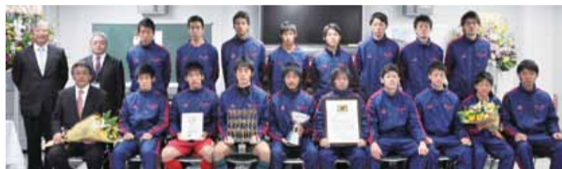
▲優勝を勝ち取った選手の皆さん