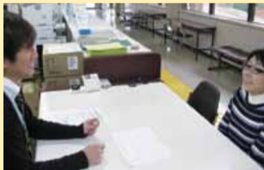
▲窓口では各種相談に応じます

ところで、償却資産という言葉をご存じですか。償却資産とは、事業者が事業のために所有している資産のことをいいます。償却資産は所有者の申告制ですが、制度をご存じないかたへは手紙を送るなどして、調査を行っています。