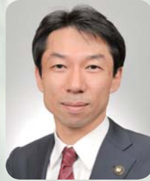
柏市長 秋山 浩保

あけましておめでとうございます。皆様には、2013年の新年を健やかに迎えたいと、心よりお喜び申し上げます。