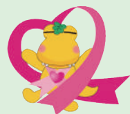
ピンクリボン×カシワニ