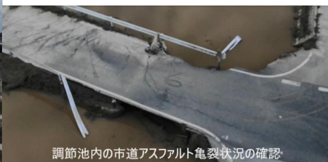
調節池内の市道アスファルト亀裂状況の確認