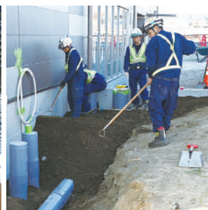
下水道管をしっかりと埋め込み