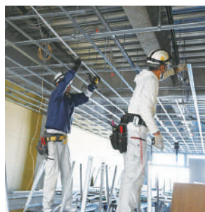
天井の骨組みを固定

駅前という立地を生かし、お出かけの帰り道に立ち寄ったり、休日にゆっくり買い物を楽しんだりできるのも魅力です。どのような店舗が入るのか、今から楽しみです。