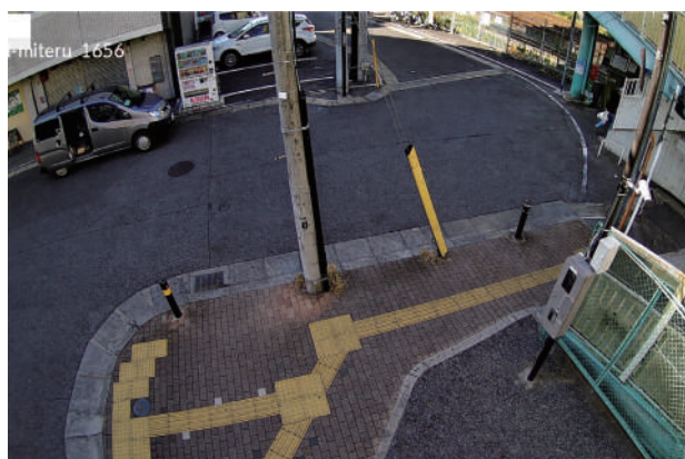
防犯カメラの実際の映像