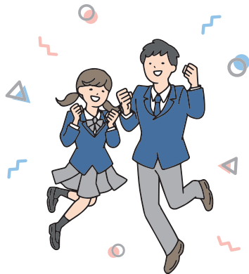
図 同実行委員会 ☎080-5386-0150、 生涯学習課 ☎7191-7393