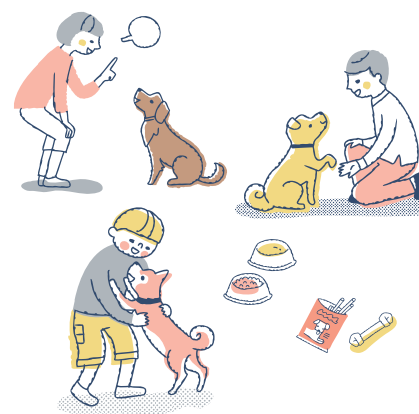
図 動物愛護ふれあいセンター ☎7190-2828