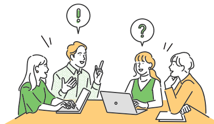
図 福祉政策課 ☎7167-1131