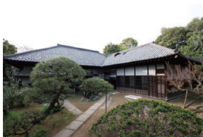
図 染谷家住宅 ☎080-7835-2330、文化課 ☎7191-7414