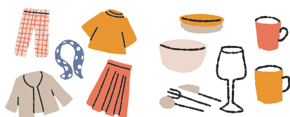
図 リサイクルプラザリボン館 ☎7199-5082 (月曜日休館、祝日の場合は翌日休館)