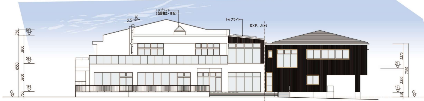
南側 (高田緑地側) から見た高田近隣センター