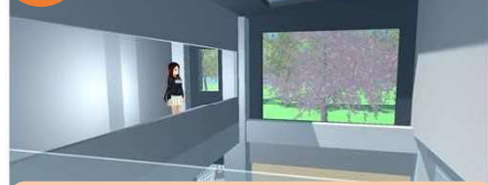
2階B案 渡り廊下から高田緑地を見る (左側に談話スペース)