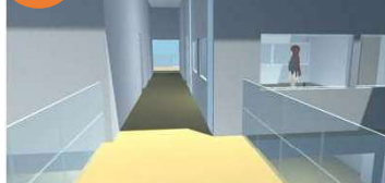
2階B案 渡り廊下からテラスを見る (右側に調理実習室)