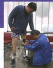
義足の調整を行う 義肢装具士