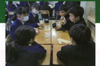
総合的な学習の時間に災害発生時の行動を グループワークを通して考えるJRCメンバー (研究推進校における公開研究会)