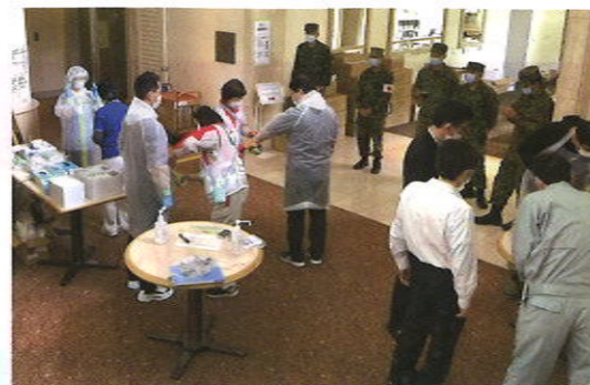
成田市内ホテルにおける医療活動

大型クルーズ船や外国からの帰国感染者対応のため医療救護班派遣。成田市内ホテルにおける医療活動を行いました。