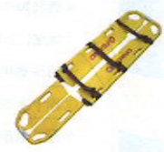
傷病者搬送用ストレッチャー