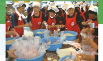
防災訓練における炊き出し