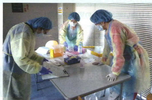
税務大学校における医療活動

皆様のご支援により、大規模災害に備えるための救護装備を整備することができました。また、被災者にお届けする救援物資を、県内9か所にある支部拠点倉庫に備蓄しています。