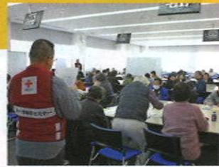
赤十字防災セミナー指導者養成講習