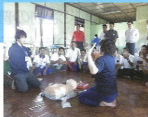
海外赤十字社救急法普及支援事業