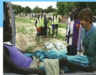
南スーダン共和国紛争犠牲者支援事業 ICRC