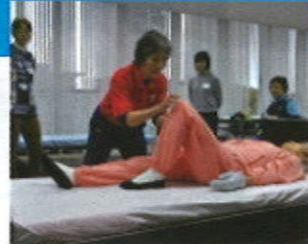
健康生活支援講習