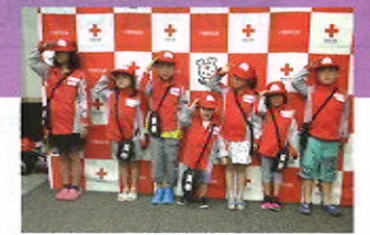
救護員体験をする子供達 (赤十字KIDS CROSS)