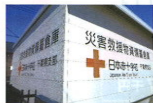
災害救援物資拠点倉庫(市川市)