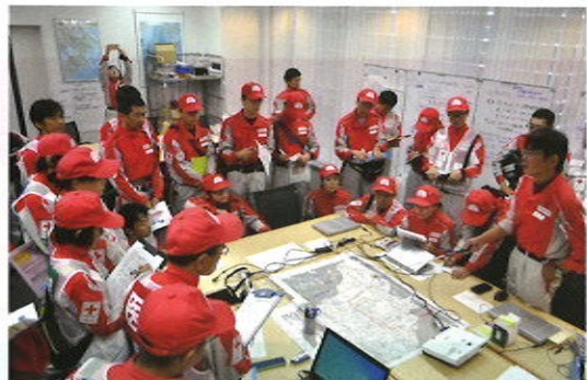
災害対策本部におけるミーティング

被害が大きい千葉県の各所に、救護班の派遣や救援物資の配布、避難所などの巡回診療などの活動を行いました。