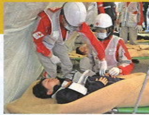
傷病者の手当をする救護班 (国民保護実働訓練)