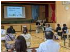
防災クロスロード