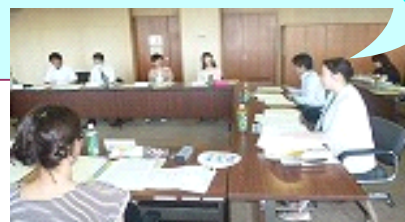
消費者教育授業実践計画について 柏市教育委員会からの講評を聞く