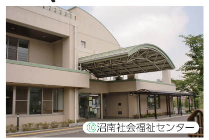
【バス停はジョイファーズ高柳店前にあります】