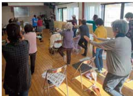
気軽に楽しくフレイル予防体操