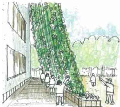
緑のカーテンの内側は涼しい！

緑のカーテンは、夏の日差しを和らげ、室温の上昇を抑える自然のカーテンです。“ヘチマ”や“ゴーヤ”などのつる性の植物を窓の外に這わせ、日が当たると葉の蒸発作用により、涼しい風が流れ込み、家庭のクーラーの使用を減らすことができます。また、地球温暖化の大きな原因となっているCO 2 （二酸化炭素）を吸収したりします。是非、カーテン緑化に取り組みましょう！！