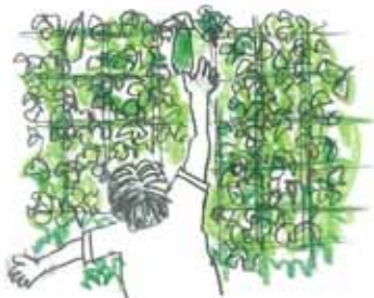
ゴーヤなどを収穫することも！