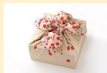
風呂敷の包み方教室