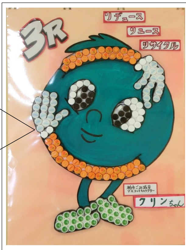
ペットボトルのキャップで作ったクリンちゃん