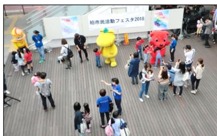
チーバ君・ガスタン・レイ君 子供たちに大人気

今年のリボン館の出展場所は、柏駅前ハウディモールでした。運営委員会で作った帽子、バッグ、小物入れ等の啓発品を販売し、リボン館だよりを道行く人に手渡し、リボン館活動の紹介をしました。