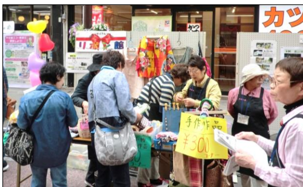
手作りの啓発品、好評でした。

リボン館運営委員会は5月13日(日)に開催された「柏市民活動フェスタ2018」に出展参加しました。