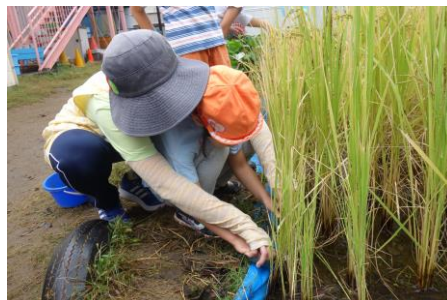
ハサミを使って稲刈りをします。

伝統行事や遊びを、たくさん体験します。お月見団子作りにお芋ほり、クッキングなど、子どもの心に残る保育を行っています。また、心も体も元気に育つことを願い、異年齢のかかわりや主体的な遊びを経験しています。