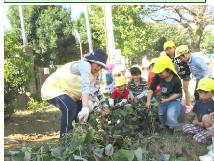
春から育てたお芋で“いもほり”をします。