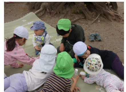
小さなお友だちとかかわって遊びます。