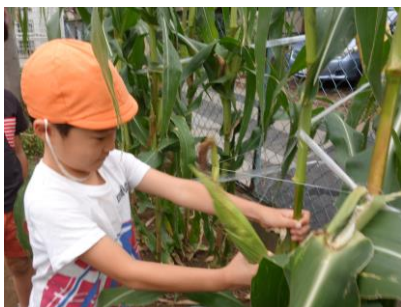
野菜の収穫。みんな興味津々。