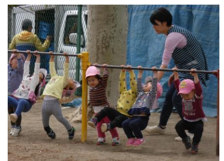
体を動かしてたくさん遊びます。