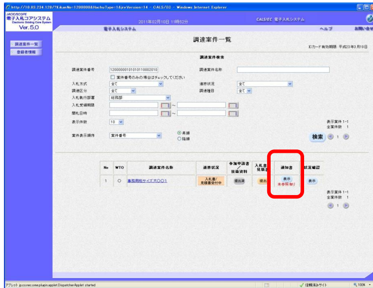
図1 電子入札システム 物品・委託 調達案件一覧