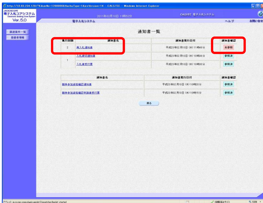
図2 電子入札システム 物品・委託 通知書一覧