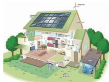
資料：第二期柏市地球温暖化対策計画