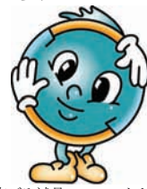
柏市ごみ減量マスコットキャラクター