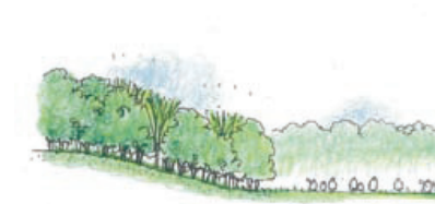
資料：柏市緑の基本計画