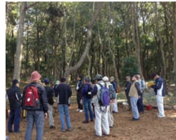
◆里山ボランティア入門講座

発行：柏市 編集：柏市 環境部 環境政策課 所在地：柏5丁目10番1号 電話：04-7167-1695 ファクス：04-7163-3728 URL：http://www.city.kashiwa.lg.jp