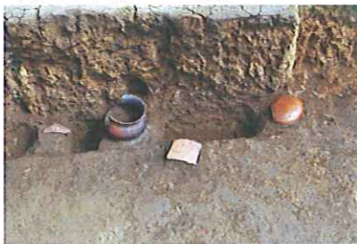
出土した数々の遺物