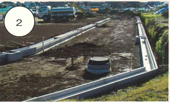
2 道路の両端に側溝を設置すると道路の形がよく分かるようになります。新設道路の整備も着々と進んでいます。