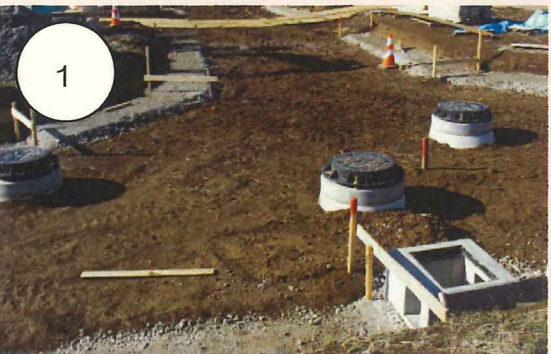
1 下水道管や水道管を新設道路の地下に埋設しています。