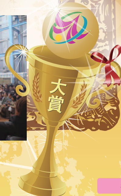
表彰式（かしわ環境フェスタ2012）