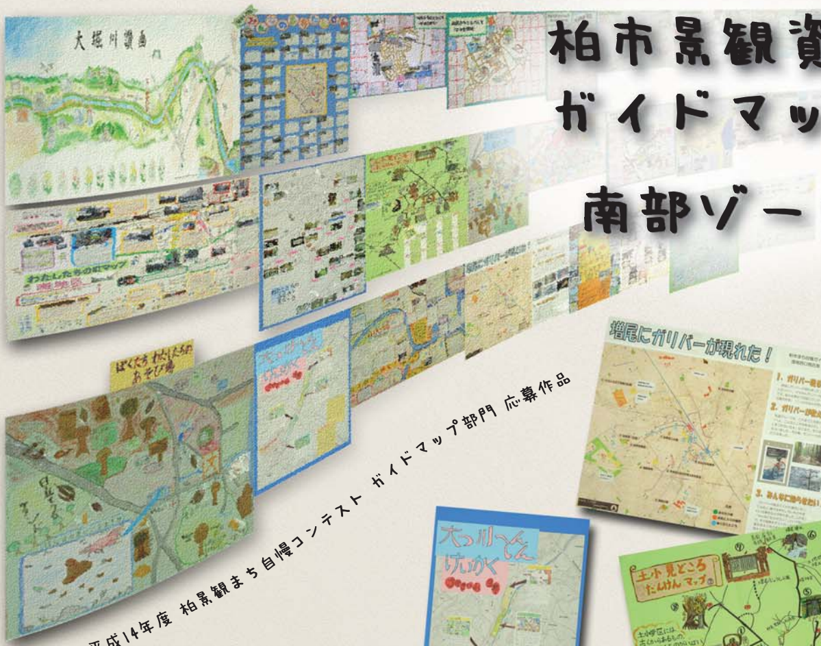
平成14年度 柏景観まち自慢コンテスト ガイドマップ部門 応募作品