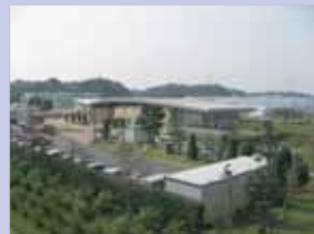
3-3道の駅しょうなん 手賀沼サイクリングロードに隣接しており、多くの人が訪れます。