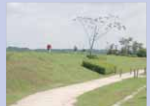
3-4手賀沼サイクリングロード 我孫子側ともつながり、手賀沼沿いを周遊する事ができます。