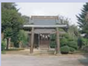
3-9星神社 ユニークな名前と共に地域のシンボルとなっています。