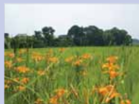
3-11染井入落の田園 水路沿いに農地、集落と斜面林が連なっています。