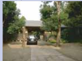
3-7鷺野谷の長屋門 立派な長屋門と樹木が印象的です。