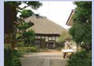
3-8鷺野谷の茅葺き民家 茅が覆われていない農家は貴重なものとなっています。