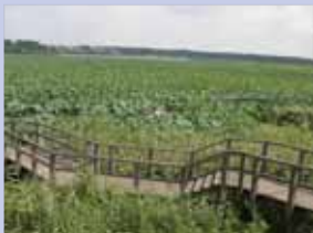
3-1手賀沼の蓮の群生地 木道も整備され、蓮の広がりを楽しめます。

街区毎に少しずつ違った表情でデザインされており、開放感のあるオープン外構が特徴の戸建て住宅地です。