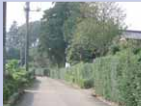
3-6生垣のある通り 農家の生垣が連なる、ほのぼのとした道です。