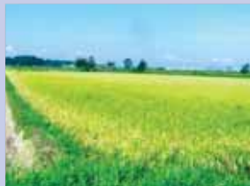
3-2手賀沼沿いの水田 低地沿いに広大な水田が広がっています。