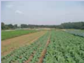
3-5岩井の農地 谷津田に仕切られた丘の上に畑と集落が広がっています。