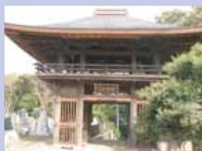
3-10福満寺 風格のある山門です。