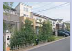
3-12湖南地区 公園を中心に、整った住宅地が広がっています。