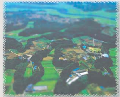
「谷津田小宇宙」 撮影：中野耕志 より