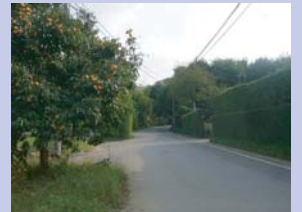
1-12福寿院付近の道 生け垣や畑が連なる、ほのぼのとした歩きやすい道です。