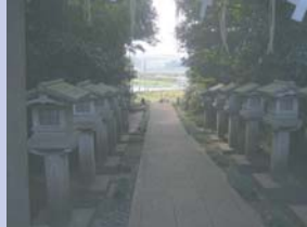
1-5高台に建つ神明社 参道の向こうに大津川と田園を望みます。