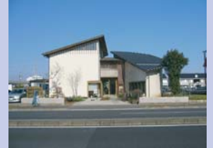
1-7中村順二美術館 ギャラリーとカフェを併設し、美しい建物デザインが目をはきまします。