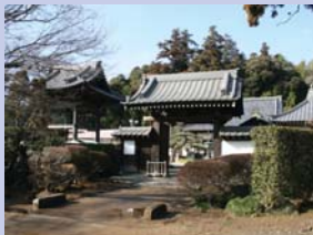
1-9善龍寺と五葉松 周囲の森を背景としたお寺です。境内には、立派な五葉松があります。