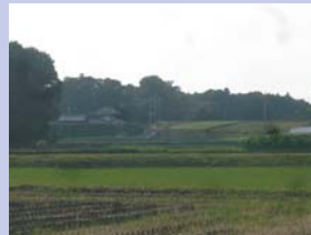
1-11大津川から見た藤心田園 なだらかな起伏の田畑と周辺の雑木林や建物が調和した田園風景です。