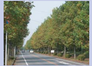
1-2ゆりの木の並木道 大きく成長し、豊かな樹陰を創り出しています。