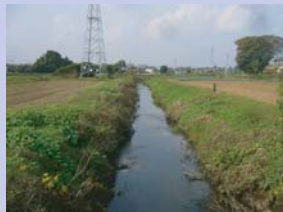
1-10大津川の眺め ときおり水辺を散歩する人とすれ違います。