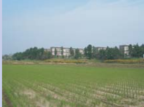
1-4大津川から見た大津ヶ丘 周囲を取り巻く緑が田園と住宅地を調和させています。