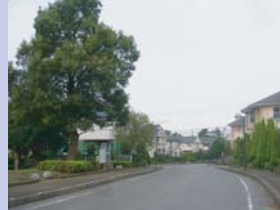
1-6大津ヶ丘パークヴィラ 電線を通り沿いに出さないなど、工夫が随所に見られます。