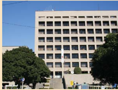
D-2柏市役所 第二庁舎は、市役所通り正面に位置し、周辺には公民館や図書館などが集積しています。