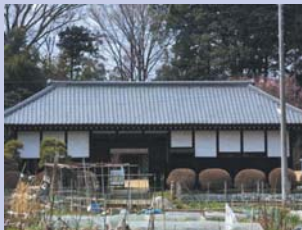
6-7長屋門 重厚な造りです。旧家のたたずまいを残す農家が点在します。