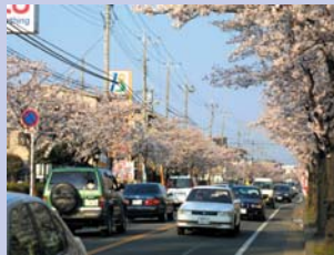
6-4新柏通りの桜並木 区画整理後、市街化が進み、桜並木も育ってきました。