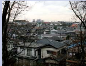
6-3亀甲台公園からの眺め 周辺に戸建て住宅地が広がる様子がよく分かります。