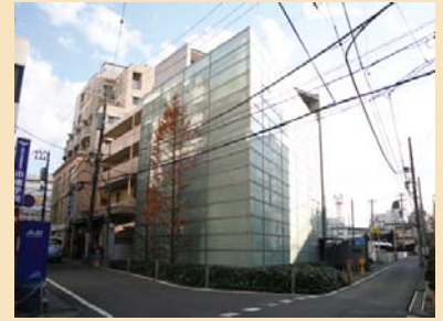
D-3街角のビル 道路から建物を後退させ、シンボルとなる高木を植えたり、コーナー部分に緑地帯を配置したりしています。