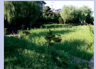
6-9名戸ヶ谷湧水周辺の整備 ビオトープを取り入れた公園が整備されています。