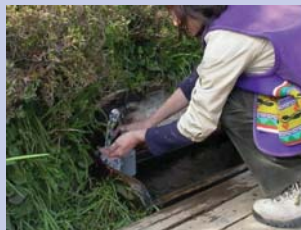
6-8名戸ヶ谷湧水 地域の人に親しまれる湧水です。