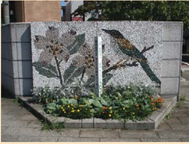
D-1歩道の壁画と花壇 歩道の角に設けられた壁画と花壇が、歩行者を楽しませてくれます。