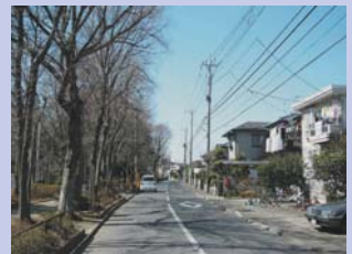
6-5永楽台公園前の住宅地 住宅地の落ち着いた街並みや庭木が公園の緑と調和しています。