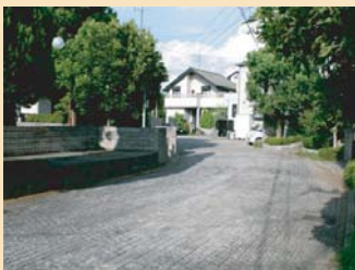
D-7柏字羽黒前の住宅地 小規模な戸建て住宅地ですが、エントランスのサインや曲線を取り入れた住宅内の道路線形、石貼りの舗装など、細やかなデザインの工夫がなされています。