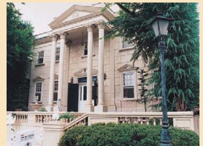
D-6欧風建物の喫茶店 宮殿風の建物で、全体的にしっかりと造りこまれ、雰囲気の良いデザインとなっています。