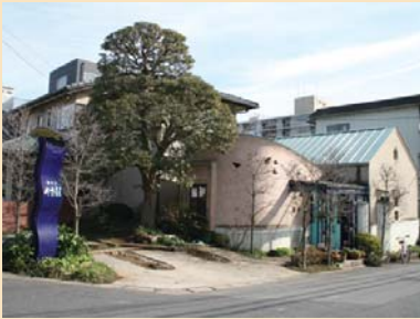
D-4花いっぱい喫茶店 花や緑をおしゃれにしつらえ、街角の穏やかなアクセントとなっています。