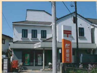
D-5お洒落な郵便局 住宅地内に立地するお洒落な郵便局が街角を特徴づけ、たまりのスペースとなっています。