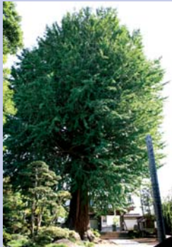
6-6法林寺の大いちょう お寺と共に地域のシンボルとして親しまれています。