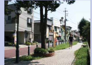
6-2レイソルロード（柏三小付近） レイソルの旗が続く商店街。小学校前に歩道が整備されています。