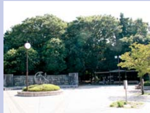
6-1日立台公園 日立柏サッカー場とともに、レクリエーションの拠点となっています。