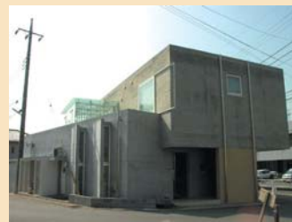
D-8東二丁目付近の事務所 全体としてはシンプルながら、自転車置場（写真右）やゴミ置き場（写真左電柱付近）を建物デザインに組み込むなどの工夫が施されています。