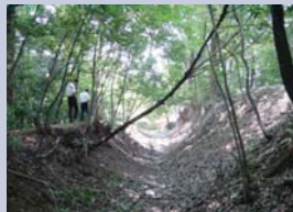
3-1 柏最大の野馬土手

旧水戸街道、旧日光街道に昔あった松並木は失われてしまいましたが、南柏緑地保全地区の野馬土手や平地林が縁どる特徴的な景観があります。今後の新たな景観形成に活かされていくことが期待されます。