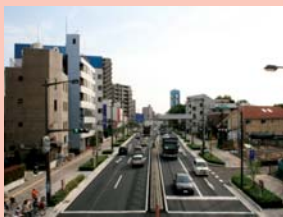
1-11西口・国道6号 落ち着いたデザインの街路整備。街並みも変わりつつあります。