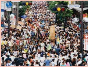
1-21柏まつり 柏最大のお祭りは駅前一帯を使い、通りを埋め尽くすにぎわいとなります。