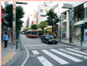
1-3東口・ハウディモール 終日人通りの絶えない東口のメインストリートの一つです。