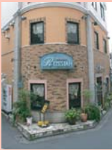
1-16西口・駅ビル映画館前の店舗 街角を意識したデザインが景観を特徴づけています。