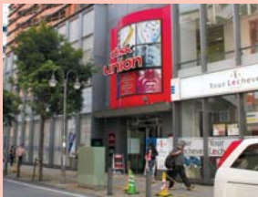
1-6東口・セントラルパル通り 市営駐車場と店舗や事務所を複合し、にぎわいの連続性に配慮しています。