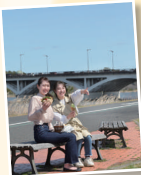
手賀沼のほとりでの1枚