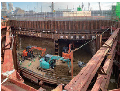
国道の下を掘り始めた様子

ここは柏の葉と柏たなかをつなぐ県道を作る工事現場。現在、国道16号の下をくぐるトンネルが完成したところです。まず国道の両脇にそれぞれ深さ約10メートルの穴を掘り、その穴から国道の下を貫通させたそう。