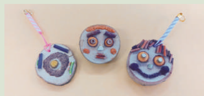
▲木材を加工して作ったストラップとブローチ